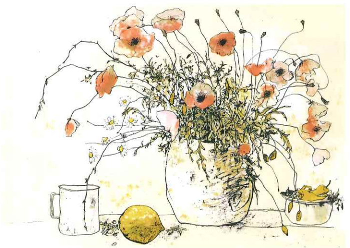
安曇野ジャンセン美術館 ジャン・ジャンセン「コクリコ」1982年