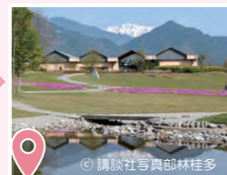
8 安曇野ちひろ美術館 Azumino Chihiro Art Museum