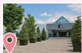
2 アートヒルズミュージアム Azumino Arthills Museum of Glass