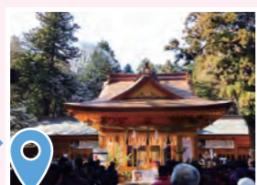
1 穂高神社 Hotaka Shrine