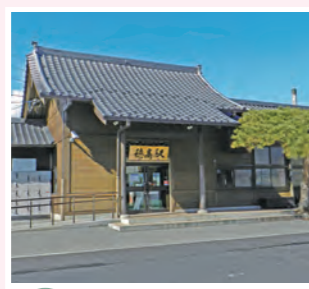
穂高駅 JR 大系線 Hotaka Station JR Oito Line