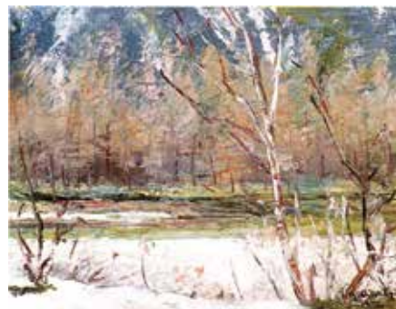
安曇野山岳美術館「春雨の梓川」