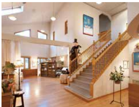
絵本美術館 森のおうち(ロビー)

Enjoy visiting 9 different museums in Azumino!