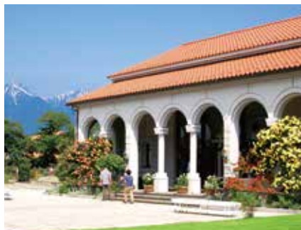
安曇野市豊科近代美術館