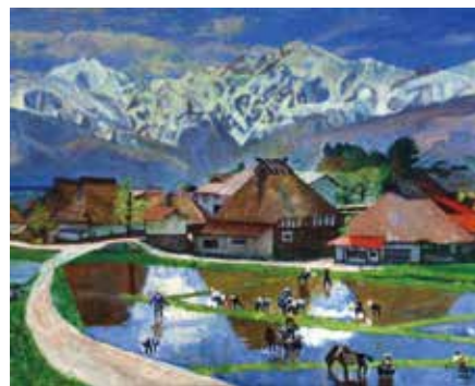
北アルプス展望美術館「山麓の田植」