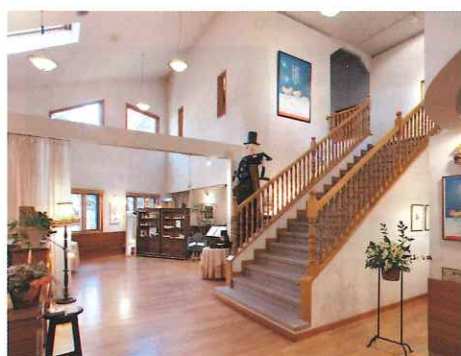
絵本美術館 森のおうち(ロビー)

Enjoy visiting 9 different museums in Azumino!