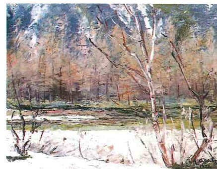
安曇野山岳美術館「春雨の梓川」