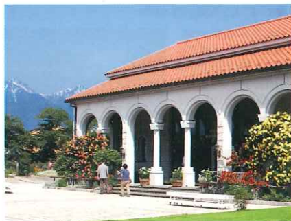
安曇野市豊科近代美術館