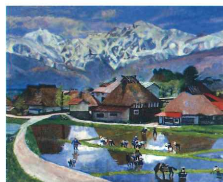
北アルプス展望美術館「山麓の田舎」