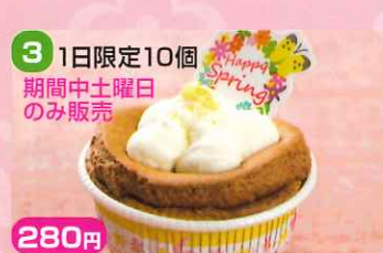
3 280円 1日限定10個 期間中土曜日 のみ販売

アルプスの山々に咲く花に見立てたアーモンドスライスをふんだんに使った、シナモンが香る黒糖味のクッキーです。