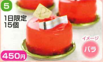
5 450円 1日限定 15個

桜の花のペーストとマスカルポーネチーズを使用し、安曇野の春を満喫していただけるよう仕上げました。春香る桜の風味をご賞味ください。