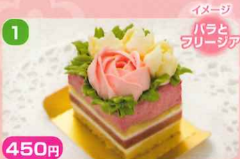
1 450円 サントウール ムラカミ フロアラル

西洋さくらんぼの甘酸っぱいムースをメインに、ホワイトチョコクリーム、さくらんぼジュレとアーモンドたっぷりの香ばしい生地をご一緒に。華やかなフロワーケーキをイメージしたフロワーケーキです。