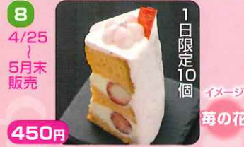
8 450円 4/25 5月末 販売

Chiffon (シフォン) 桜ロールケーキ 生クリームで仕上げたなめらかな食感の手作りロールケーキです。