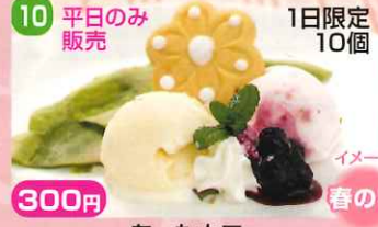
12 400円 1日限定6個

Patisserie RIRE (パティスリーリール) パルファン ショコラブランのムースにバラの香りを付けました。フランボワーズのムースと苺のジュレを中に入れ、味の素材と香りの素材を優しい味にまとめました。