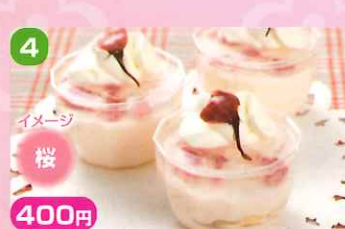
4 400円 桜

焼き菓子工房 MYU 安曇野産アカシアはちみつとレモンのカップシフォンケーキ 安曇野産のアカシアはちみつを使用し、レモンピールと生クリームでシンプルに仕上げました。はちみつとレモンのさわやかな味と香りを楽しんでいただけたらと思います。