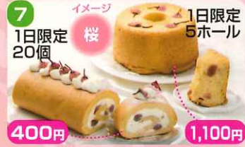
7 400円 1日限定 20個

あづみ野菓子工房 彩香 プレミアムロールケーキ 春のお花畑をイメージして、ロールケーキ全面にフルーツを彩りよくトッピングしました。