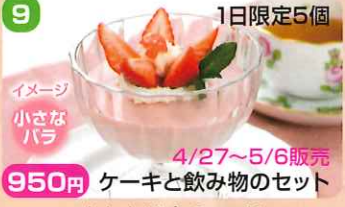
9 950円 1日限定5個 ケーキと飲み物のセット

パティスリー ポークワバ フレーズ フルール 野苺シフォンケーキの間に苺とホワイトチョコカスタードクリームをサンドし、苺のクリームをまとったスペシャルなショートケーキです。