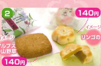
2 140円 アルプスの山 野草

西洋さくらんぼの甘酸っぱいムースをメインに、ホワイトチョコクリーム、さくらんぼジュレとアーモンドたっぷりの香ばしい生地をご一緒に。華やかなフロワーケーキをイメージしたフロワーケーキです。