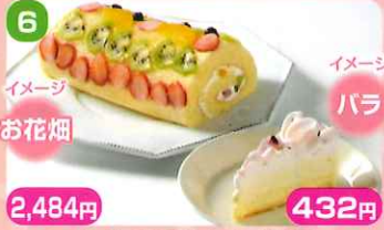
6 2,484円 お花畑

安曇野 sweets ベイサー樹 NOJIRI セラヴィ ローズ クッキーの上にチョコレートのフレック、アーモンドスポンジ、そしてホワイトチョコのムースをのせてあります。ムースの中にイチゴとバラのジュレを入れてあり、さらにバラのジュレを上にかけてあります。